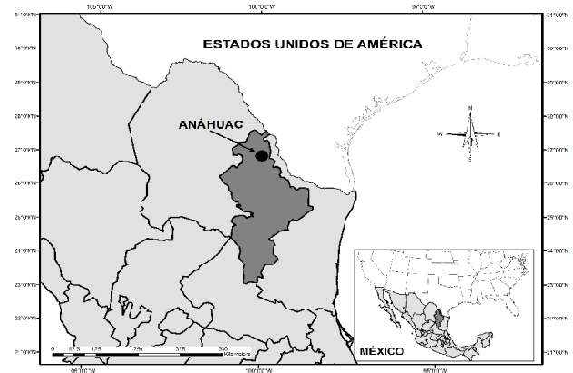
Figure 1. Localización del área de estudio

system for the past 12 yr and is divided into 64 pastures, each grazed for 3 to 6 d at a time. Each pasture in this system has drinkers or reservoirs to supply water and thus reduce the energy expenditure required to move to distant water sources. Separated by 14.5 km, both ranches have native vegetation as well as Buffel grass ( Cenchrus ciliaris ), an introduced species used as feed during droughts. During dry seasons, cactus scorching is done occasionally. Under optimum conditions and normal rainfall, the ranches produce 335 kg/ha of usable biomass (26) .